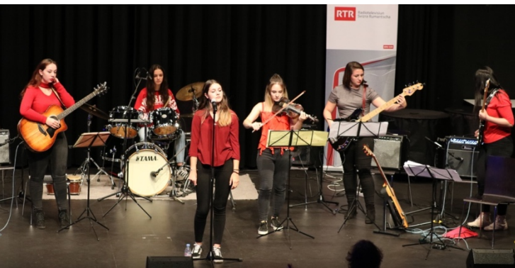
RED ROSES AUS BRUSIO BEIM JUBILÄUMSSCHLUSSKONZERT